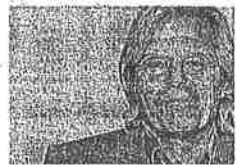
LA COLUMNA INVITADA JAVIER NART

Ahora, las instituciones financieras deben cubrir las necesidades de financiación de las actividades productivas rentables, o por el contrario los problemas de morosidad se intensificarán. Las entidades finan-